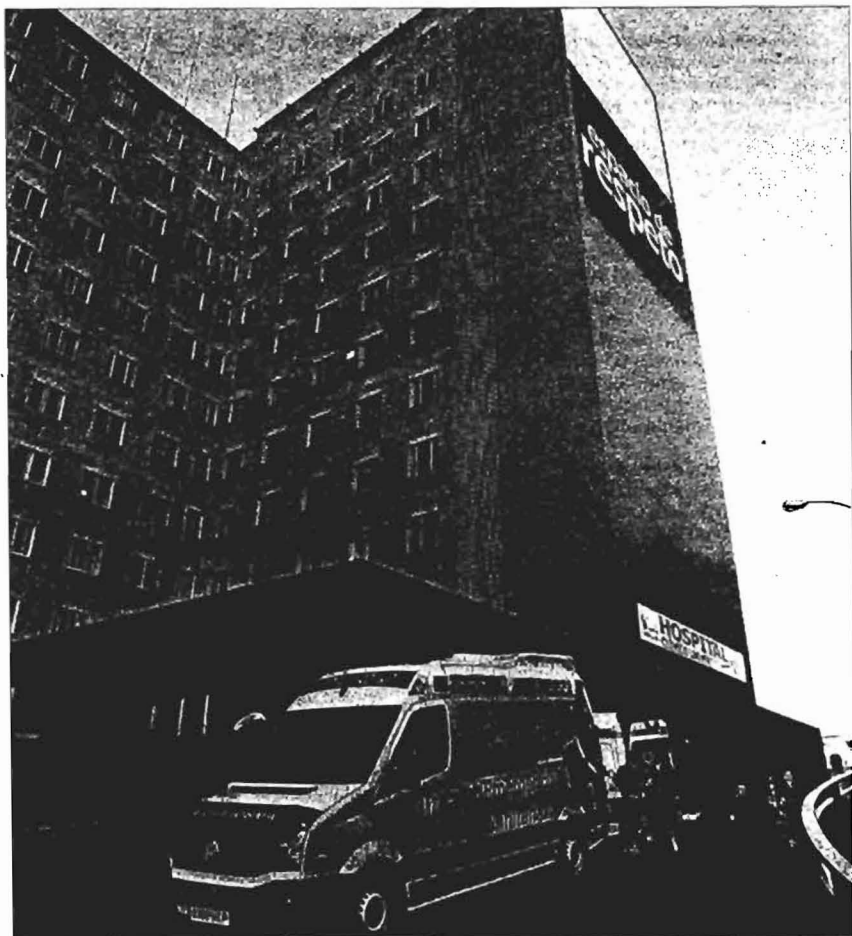
Fachada del Clínico de Valladolid, el hospital con mayor tiempo de espera quirúrgica.

► Palencia. El tiempo medio de espera no ha variado en el último año. Los hospitales pequeños presentan un mejor comportamiento, anota el consejero. El de Palencia se mantiene en los 32 días, aunque